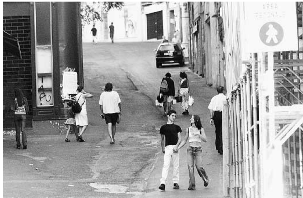
Via Manno: tra due settimane diventerà un nuovo cantiere.

Descrivere la faccia e le urla dei commercianti di via Manno davanti al "regalo" della Wind (e di chi ha concesso l'autorizzazione) è perfettamente inutile. «Siamo arrivati all'anarchia più completa - ha dichiarato uno dei commercianti colpiti dal provvedi-