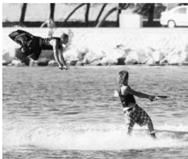
Sci d'acqua acrobatico a Su Siccu.

A completare l'opera, la grande festa polinesiana di sabato notte nell'Anfiteatro di Marina Piccola, con tanto di ballerine hawaiana