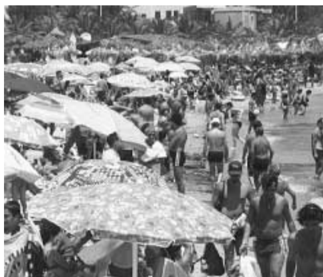
La spiaggia del Poetto affollata di bagnanti.