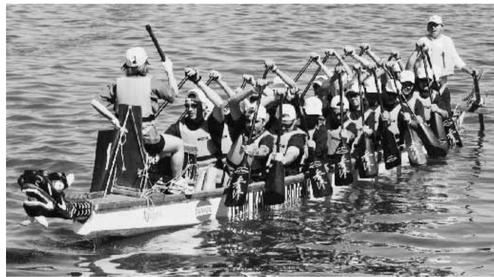
Una fase della manifestazione di "dragon boat" a Terramaini.