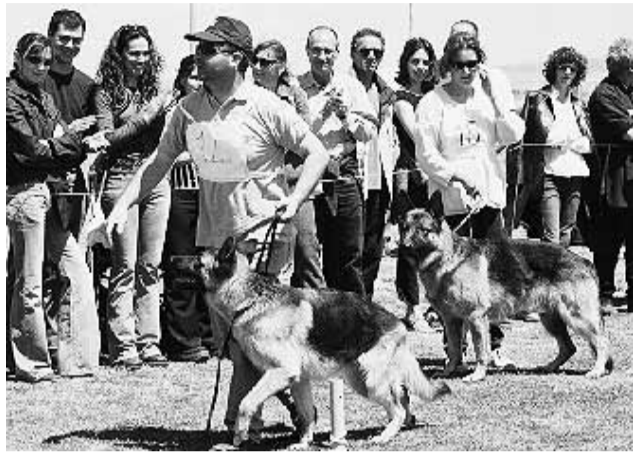
I "campioni" sfilano in passerella.

Margò della Carlotta, sette anni, ha il manto nero focato, il passo altero e sicuro, e una grande dimestichezza con la passerella (che in questo caso si chiama ring). È lei la "reginetta", la vincitrice del campionato regionale del pastore tedesco. Bea di Aurelius Victor, tre anni, è arrivata seconda, «ma è quasi un ex-aequo». Terza Bella del Catone, anche lei ha preso il massimo: eccellente. Molto buono per il maschio più bello, Dorian di Valle Doria. Sessantadue cani hanno partecipato ieri al campionato regionale del pastore tedesco, organizzato dalla "Sas karalis" di Capoterra, nei campi sportivi della quinta fermata del Poetto. Alla loro prima apparizione anche alcuni cuccioli di due, tre mesi. Con tutto il rispetto per